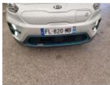
Capot, Grêlé, Forfait grêle (forte)