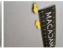
Moulure porte AVD, Dégâts chimiques, Lustrage