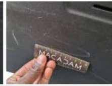
Pare-chocs AR, Griff(e)s, Peindre