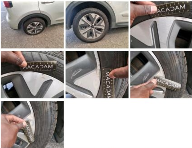
Jante alum. AVD bi-ton/polychrome, Griffes(s), Réparer/remplacer (montant forfaitaire)