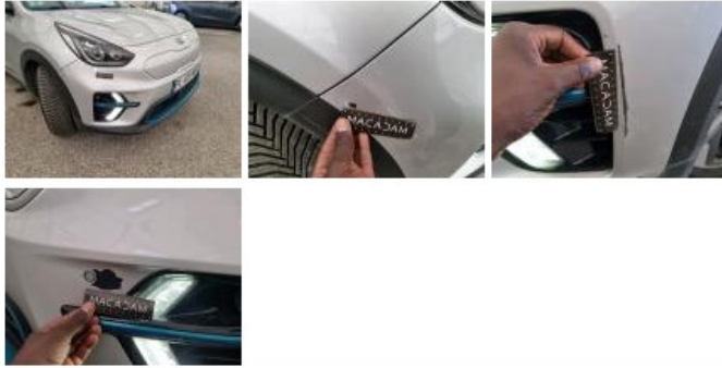
Spoiler AV, Cassé, E - Remplacer