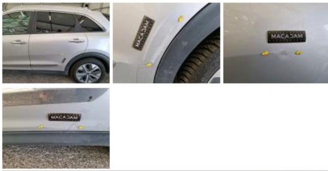
Pare-chocs AV, Griffes(s), Acceptable