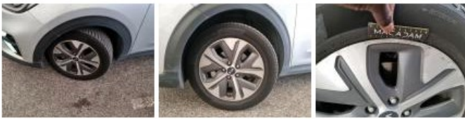
Jante alum. ARD bi-ton/polychrome, Griffes(s), Réparer/remplacer (montant forfaitaire)