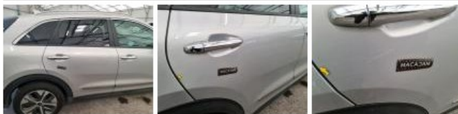
Porte AVD, Griffes(s), Acceptable