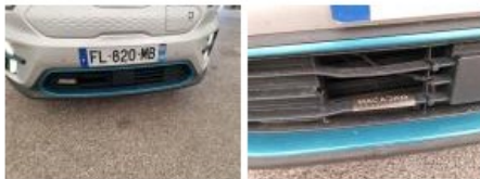
Moulure de pare-chocs AV, Griffes(s), Acceptable